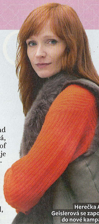
Herečka Aňa Geislerová se zapojuje do nové kampaně

Přidat svou fotografii do „Galerie třídíčů“ může nyní každý prostřednictvím webu www.samosebou.cz nebo facebookových stránek Má to smysl, třídím.